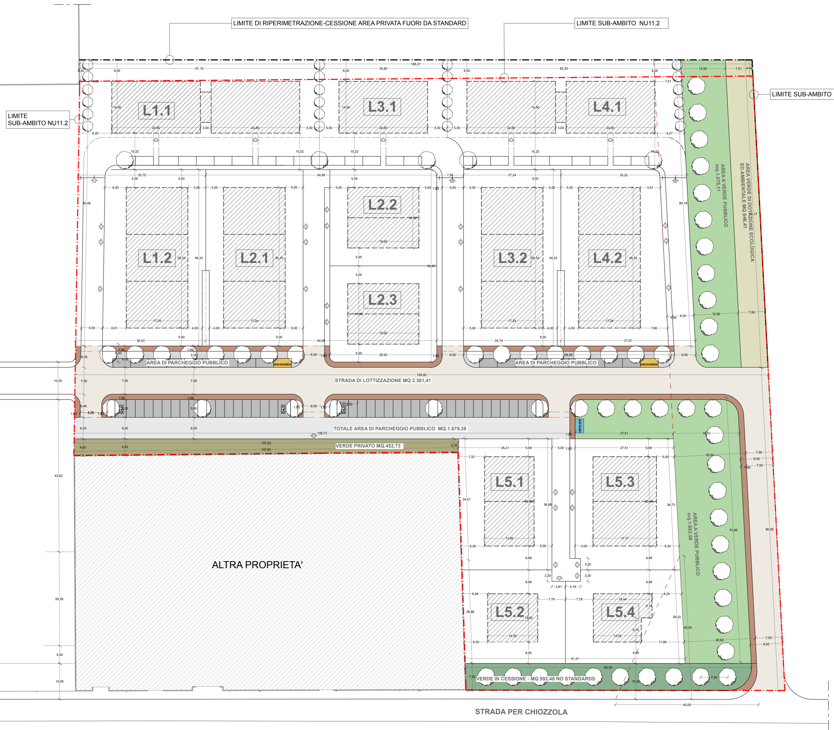
PLANIMETRIA GENERALE DI COMPARTO - SUB AMBITO NU11.2 CON INDIVIDUAZIONE AREE DI CESSIONE STANDARDS