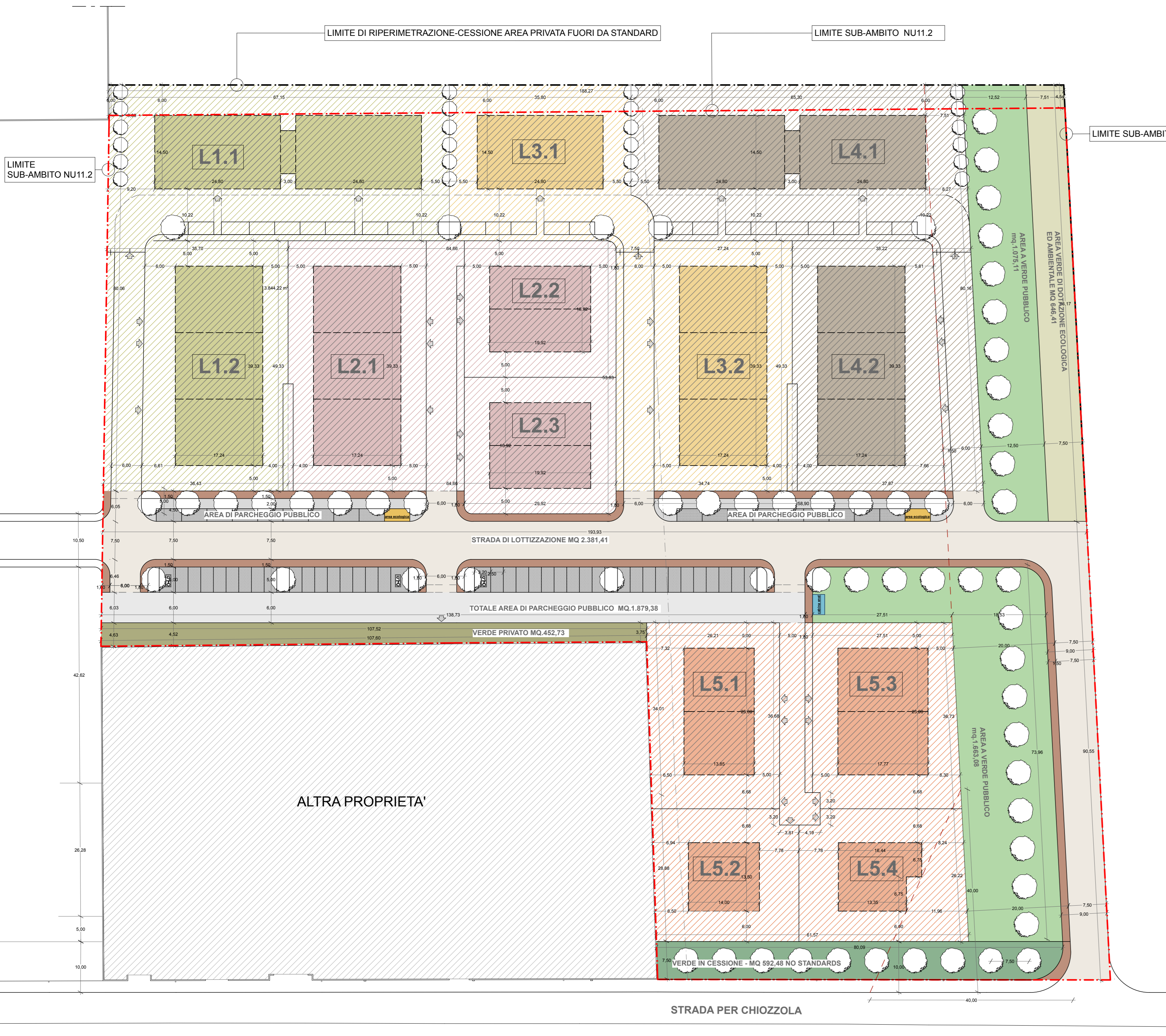
PLANIMETRIA GENERALE - ZONIZZAZIONE SUB AMBITO NU11.2 CON INDIVIDUAZIONE AREE LOTTI PRIVATI